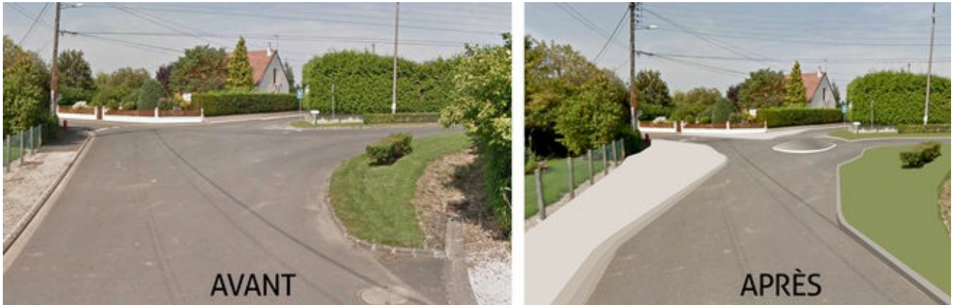
Proposition d'aménagement de carrefour (dossier AMO)

aménagements de sécurité, de traverse de bourg et d'espaces publics réparation ponctuelle de voirie assainissement pluvial routier en et hors agglomération ouvrages d'art en conception neufs ou en réparation consultation des bureaux d'études spécialisés pour les études préalables définition du programme d'entretien routier et de son coût